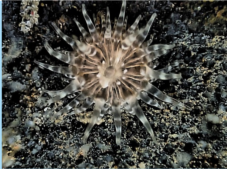
Slibanemoon op een rolsteen, steiger Grevelingenbos