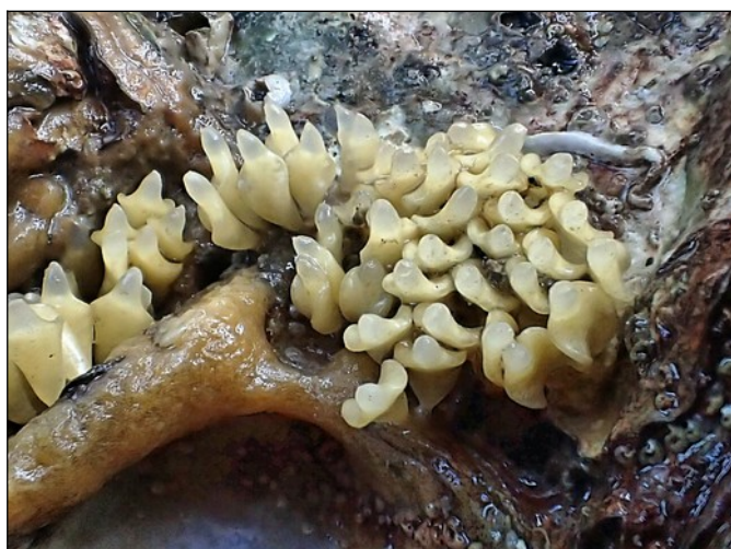
Eikapsel van de Japanse stekelhoren (4cm)