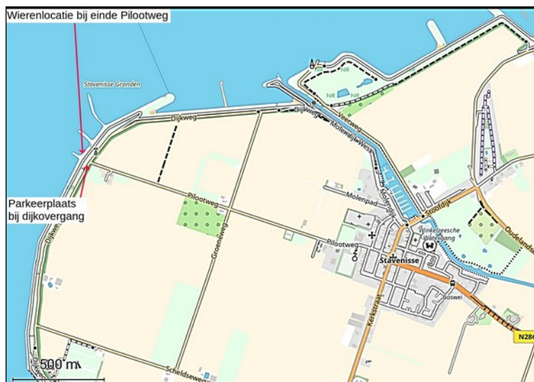
Tekst en fotos: DirkJan Dekker

Uiteindelijk waren er 9 deelnemers, de excursie eindigde omstreeks 12:00 uur.