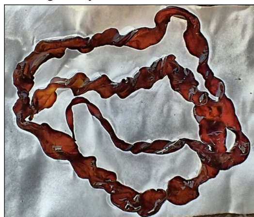
Rood darmwier, de cirkel meet 10cm