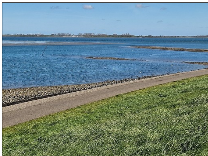
Oosterschelde bij Piloottweg, om 10:20 uur