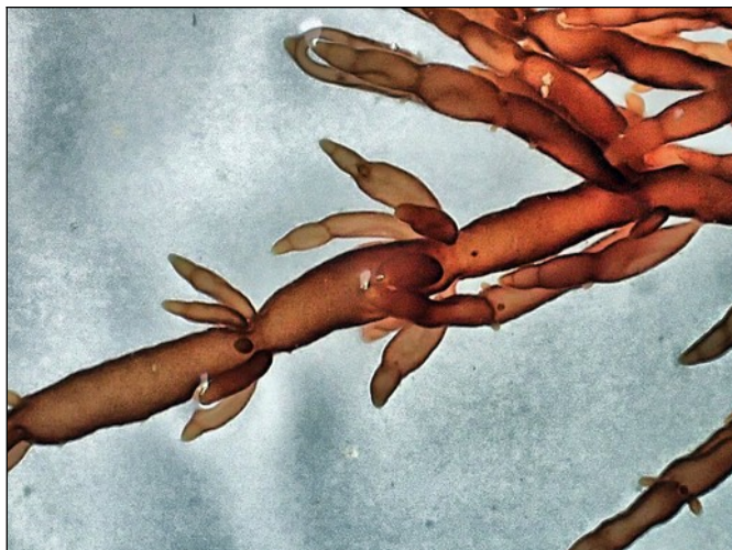
Een takje van Rood heermoeswier