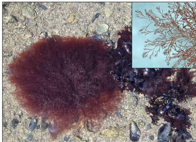
Fijn buiswier (20cm) en lers mos