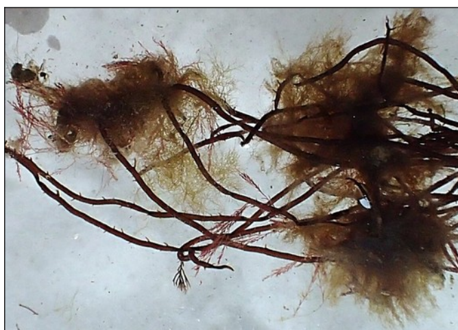
Donker knoopwier (10cm), waarop plukjes Toefjeswier