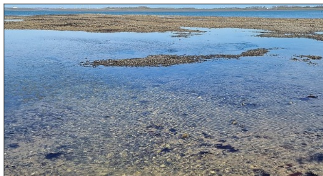
Deze foto is om 11:45 bij eb genomen Weinig wind is belangrijk, er warrelen dan geen fijne kleideeltjes op, en er zijn geen golfjes. Al met al kan je zo goed op de bodem kijken

Er werd bij aangenaam weer ontspannen rondgekeken in de ondiepe poel die tegenover de trap over de dijk ligt. We zijn niet verder gekomen, langs de rand was ook veel te zien. Het was een excursie van 50 meter heen, en 50 meter terug!