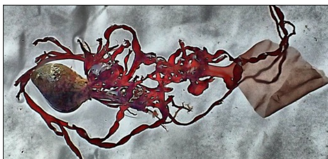
Kort stukje Donker knoopwier gehecht op een schelpje. Met Rood darmwier en een stukje Purperwier