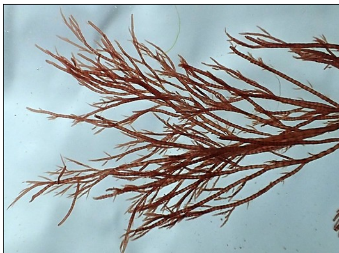
Rood horentjeswier (5cm)