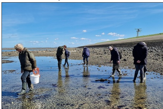
De poel met wieren, de donkere plekken zijn wieren, voornamelijk roodwieren

Er was uitzonderlijk veel Rood darmwier aanwezig, een vroeg voorjaarswier.