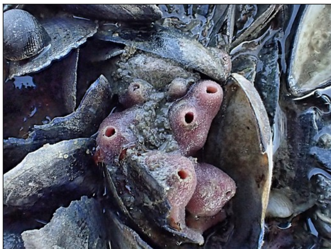
Paarse buisjessponzen (4cm, tot nu toe alleen gevonden bij de "Hauwwier" locatie)