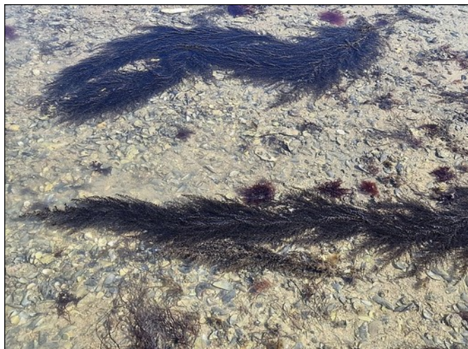
Japans bessenwier (1m, bruinwier), een exoot, overwoekert andere wieren

Dus, wat kwamen we nu, het vroege voorjaar, nog meer tegen?