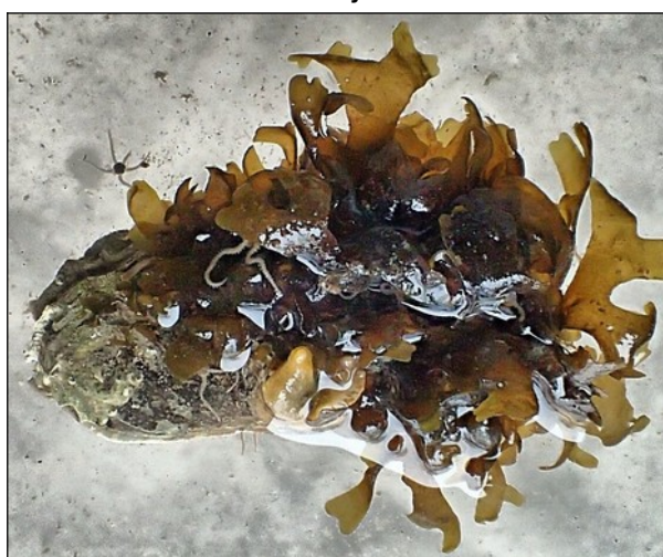
Jong lers mos (6cm) op een mosselschelp