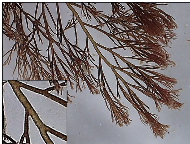
Donker buiswier, detail. De centrale buis is omgeven door 12-16 pericellen