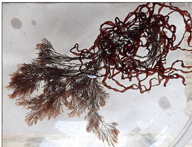
Donker buiswier (4cm), gehecht aan Rood darmwier