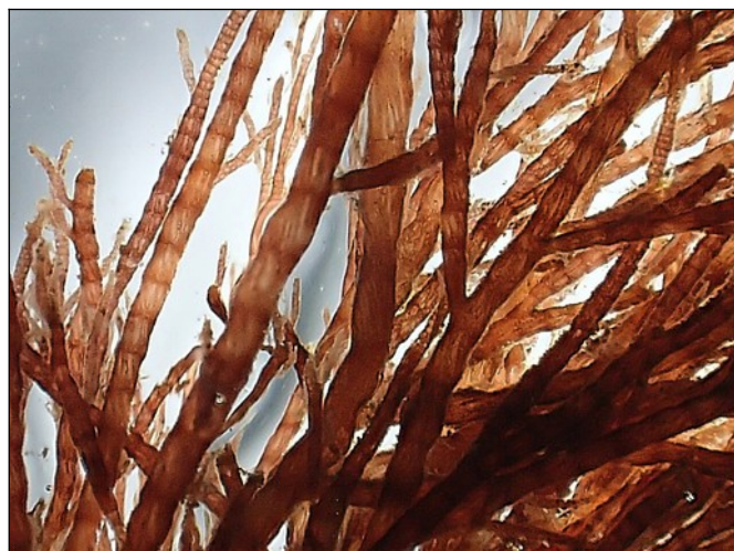
Rood horentjeswier, detail, oud exemplaar. Segmentjes vertonen schuinlopende pericellen