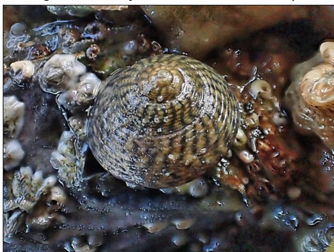
Asgrauwe tolhoren (1cm)