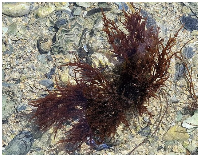
Rood heermoeswier (10cm)

Op de Pilootweg locatie is altijd wel iets bijzonders te vinden: In de poel stonden een paar struiken Rood heermoeswier, tot nu toe de enige plek die ik ken. Ook langs de rand van de poel, tussen schelpen en steentjes, was veel te vinden.