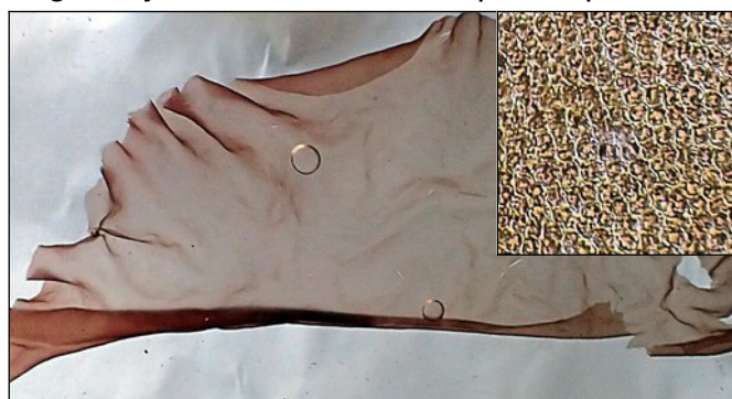
Purperwier (6cm, 1 cellaag dik), met een detail van het blad (400x)