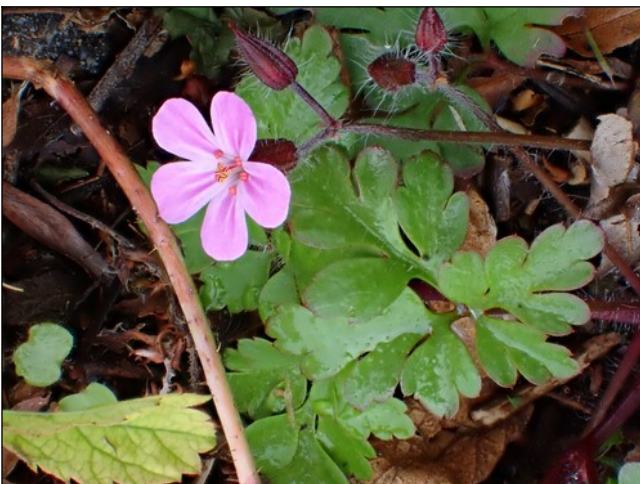
Bloemetje van Robertskruid