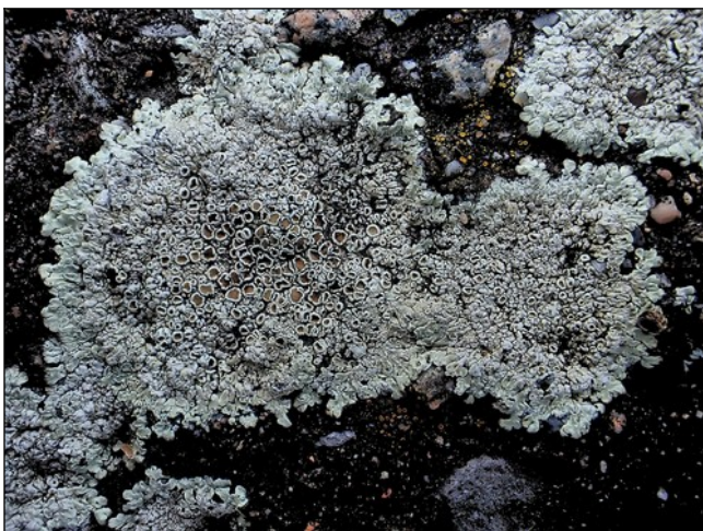
Muurschotelkorst Op het pad langs de oude dijk