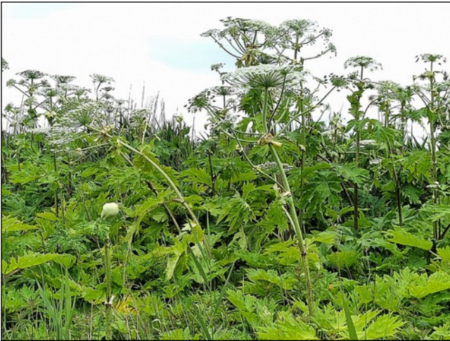
Kaukasische Berenklaauw of Reuzenberenklaauw