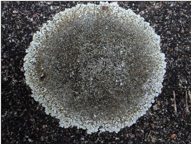
Kastanjebruine schotelkorst Op het oude tegelpad