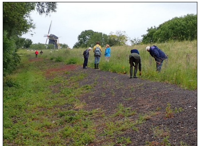
Laatste deel oostelijke wandeling