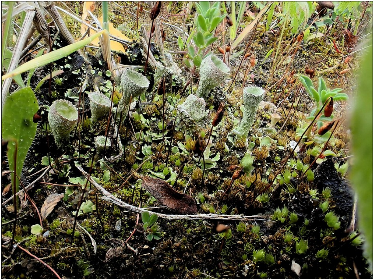
Frietzak-bekermos en Kwelderknikmos met donkere kapsels