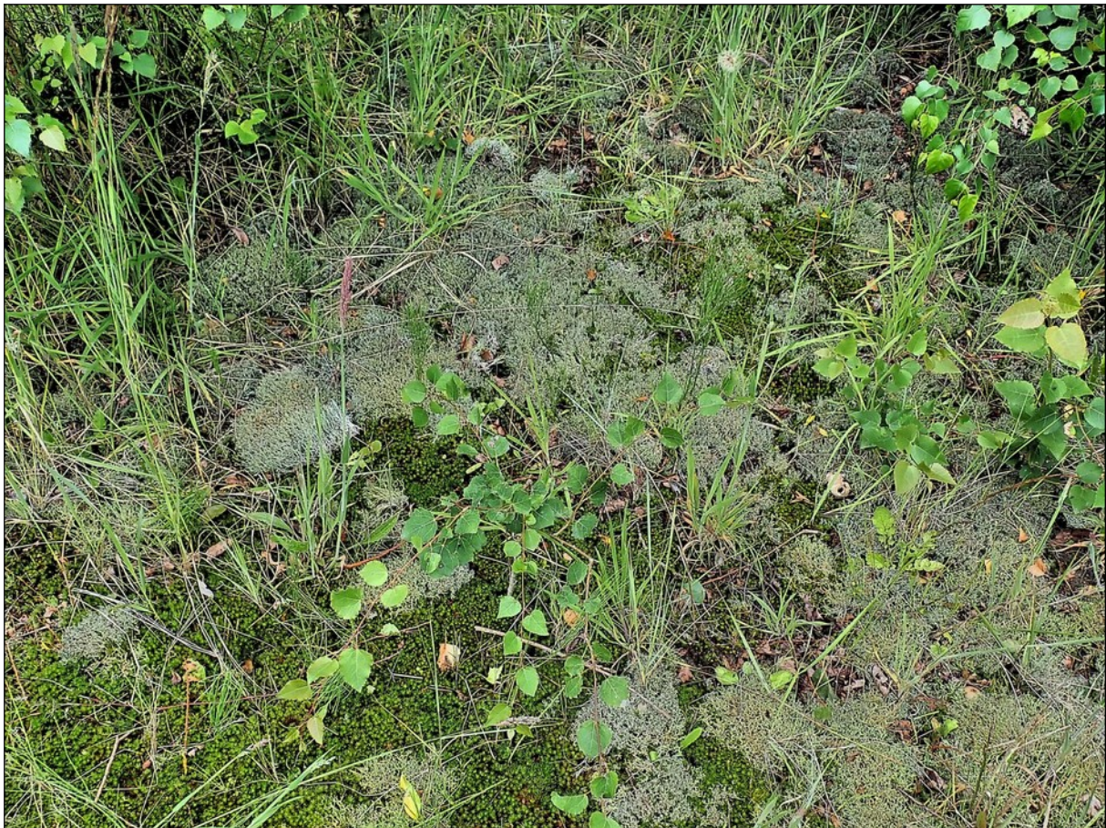
Bosjes met Gevorkt heidestaartje