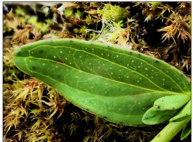
Blad van Sint Janskruid met de kenmerkende oliekiertjes