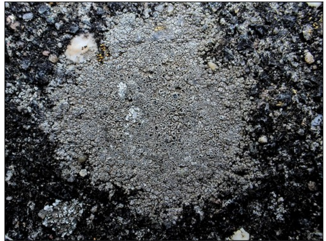
Rond dambordje Op het oude tegelpad