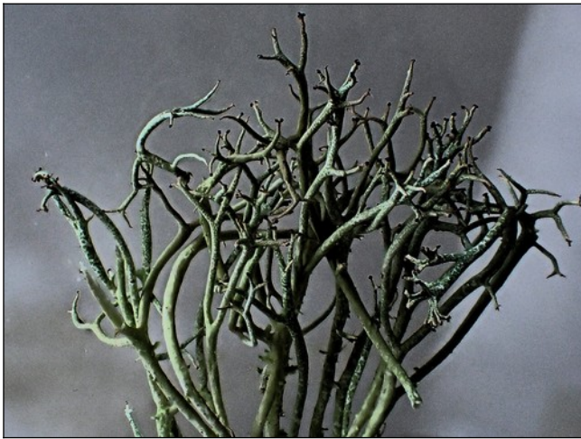
Gevorkt heidestaartje met pycnidiën