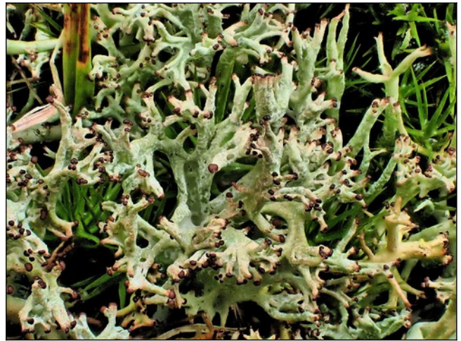
Gevorkt heidestaartje met apotheciën