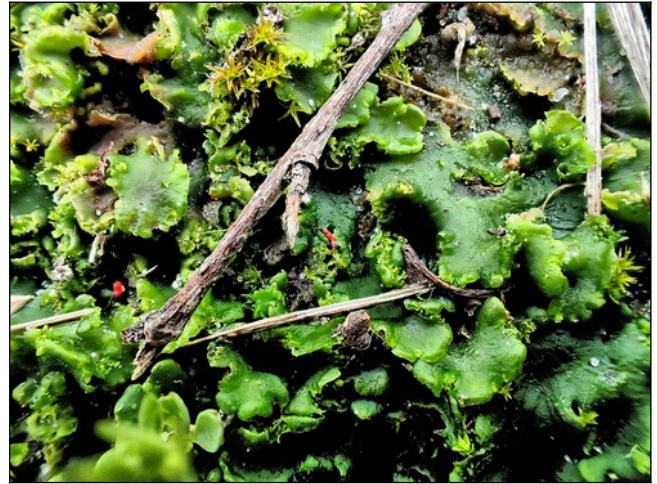
Halvemaantjesmos, een levermos Determinatie niet zeker